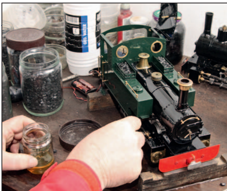
16 Kohlegefeuerte Dampfloks