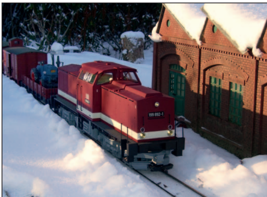
70 Gartenbahn im Winterbetrieb