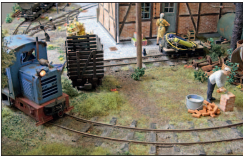
68 Kleine Innenanlage auf 1m 2