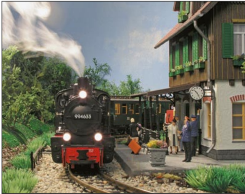
Innenanlagen mit viel Atmosphäre